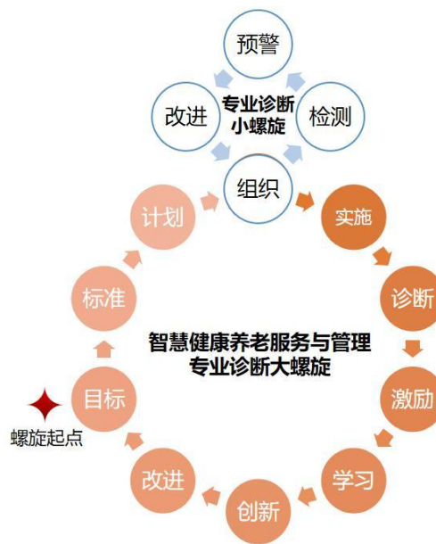
图 1 诊断与改进 8 字螺旋图

2.完善教学管理机制，加强日常教学组织运行与管理，定期开展课程建设水平和教学质量诊断与改进，建立健全巡课、听课、评教、评学等制度。建立与企业联动的实践教学环节督导制度。严明教学纪律，强化教学组织功能，定期开展公开课、示范等教研活动。